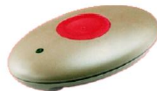
Nouzový vysílač, hmotnost 30 g, rozměry 70x50x17 mm

Zpráva o události se zobrazí na centrálním počítači, nebo může být poslána na pager nebo mobilní telefon zvolených zaměstnanců (např. ochranky soudu nebo zvolené zdravotní sestře v domově důchodců).